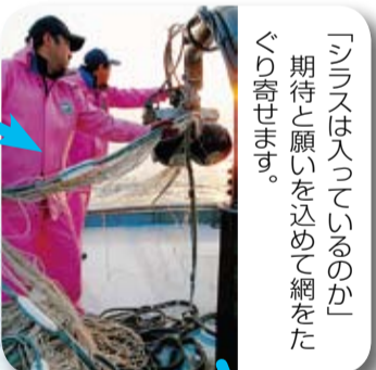
「シラスは入っているのか」期待と願いを込めて網をたぐり寄せます。