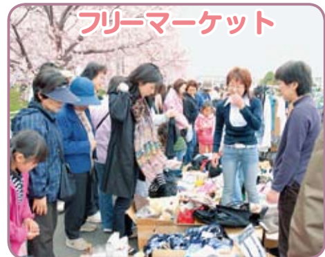
フリーマーケット