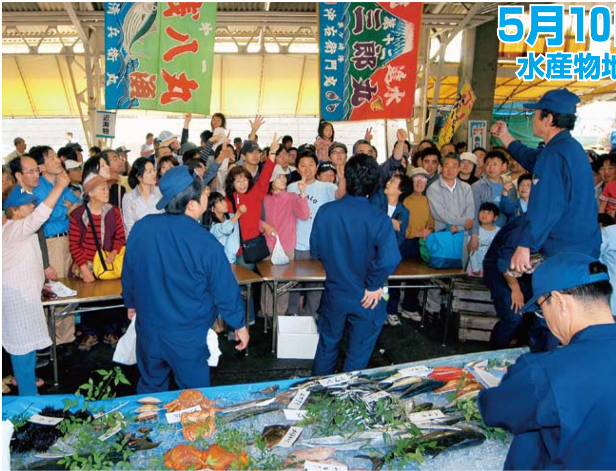
毎回大きな盛り上がりを見せる市民せり市。魚まつり朝市は魚屋、水産加工業者、漁業者、卸売業者など市場にかかわる人たちが協力して開いています。