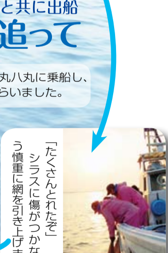
「たくさんとれたぞ」シラスに傷がつかないように慎重に網を引き上げます。