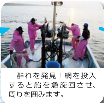
群れを発見！網を投入すると船を急旋回させ、周りを囲みます。