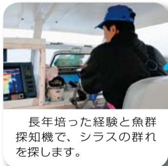
長年培った経験と魚群探知機で、シラスの群れを探します。

ロックに切り分けた後で販売します。 ◆元祖！漁師なべ 毎回大好評の漁師なべ。今回は20回目を記念して、豪華な具材が入ります。お楽しみに。 ◆市民せり市 市場のせりを体験してみませんか。珍しい魚を安く手に入れるチャンスです。