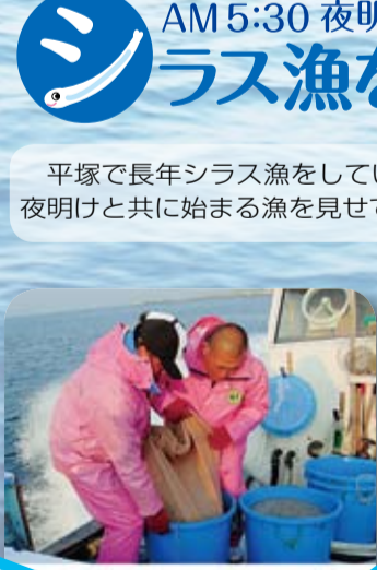
いよいよ本日最初のシラスがお目見えです。