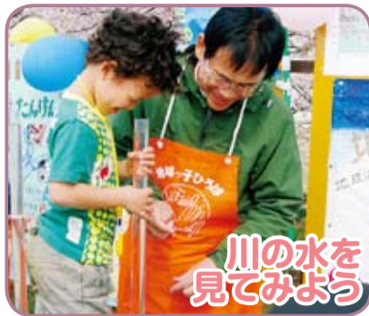
とてもきれいだね