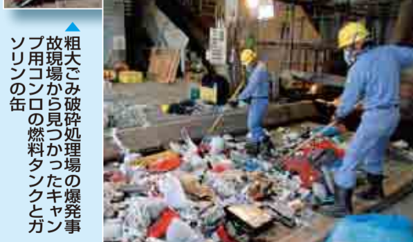
▲粗大ごみ破砕処理場の爆発事故現場から見つかったガソリンの缶