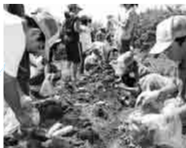
去年の夏休み子ども村でいも掘りを 楽しむ子どもたち

信州志賀高原で、農産物の収穫や農家のみなさんとの交流などを通して、農業や自然環境を勉強してみませんか。