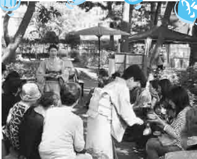
一服のお茶をいただいでのおんぼりと過ごそう

ベストセラー小説「食道楽」の執筆をはじめ、広い見識や自由な発想で活躍した明治の作家村井弦斎。そんな彼の功績をたたえ、そのゆかりの品々や文化を紹介します。