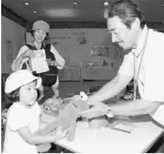
壊れたおもちゃを直す「おもちゃの病院ドクターくるりん」の活動。お客さんが喜び姿を見るのが楽しみだそうです。

市民活動とは、市民のみなさんが自分たちの力でよりよい社会をつくるために活動すること。この市民活動を紹介します。市民活動センター(☎21-7517)の「おもちゃの病院ドクターくるりん」の活動。お客さんが喜び姿を見るのが楽しみだそうです。