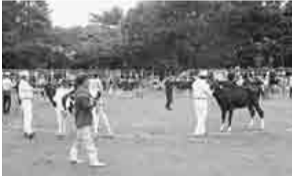
乳牛や肉豚が登場する品評会も開催

きて・みて・さわって・たのしんで 県内一位の酪農家数を誇る平塚市。また、7月に開催した県肉豚共進会では平塚の養豚農家が一位を獲得しました。畜産業が盛んな平塚で畜産農家が手塩にかけて育てた乳牛や肉豚の品評会を開きます。 品評会のほかにも、だれでも参加できる乳しぼり疑似体験やバター作り体験のイベントも開きます。 ▽日時 9月29日(火)午前10時～午後3時 ▽会場 総合公園多目的広場 ▽主なイベント ◆品評会と畜産の紹介 ・乳牛、肉豚の品評会 ・畜産紹介コーナー ◆体験・無料配布 ・乳しぼり疑似体験