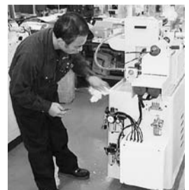
あなたのカメラのレンズを加工したのはこの機械かも

(株)湘南光学工業所は、創業以来、一貫してレンズ芯取機の製造を行っています。芯取りとは、レンズの光軸を合わせるためにミクロン単位で加工する最終工程のことです。同社の芯取機は国内シェアの約50%を占めています。長年にわたる信頼と技術力によって、大手カメラ・レンズメーカーと取り引きをしています。同社の製品で加工された光学レンズ