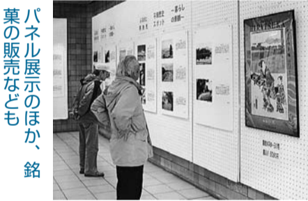
パネル展示のほか、銘菓の販売なども

新可能 ▽対象 市内にお住まいで、年間を通して農園を利用できる方 ▽申し込み方法 往復はかき、住所・氏名・電話番号・希望する区画(第1希望・第2希望)を記入し、農水産課(〒254-0051豊原町2-21・☎35-8106)へ ▽締め切り 1月31日(日) お問い合わせは、農水産課(☎35-8106)へ。