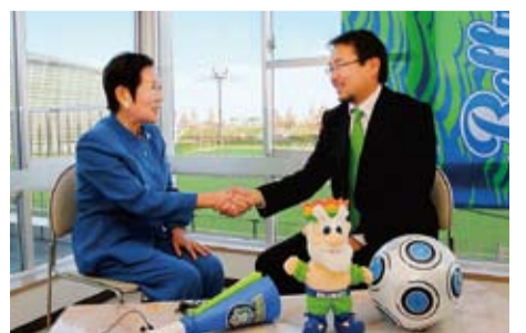
対談は湘南ベルマーレも練習に使う馬入サッカー場で行われた