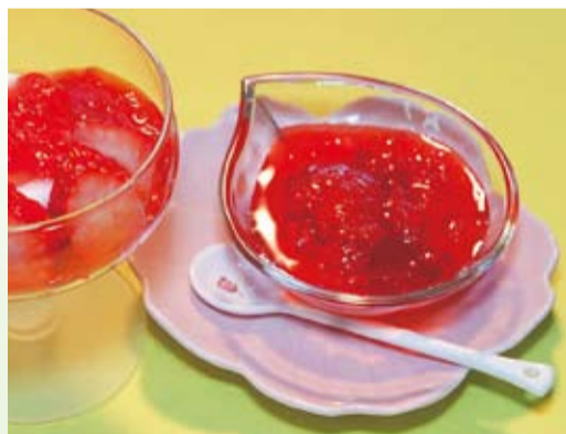
協力 平塚市食生活改善推進団体のママの会