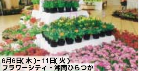
6月6日(木)~11日(火) フラワーシティ・湘南ひらつか