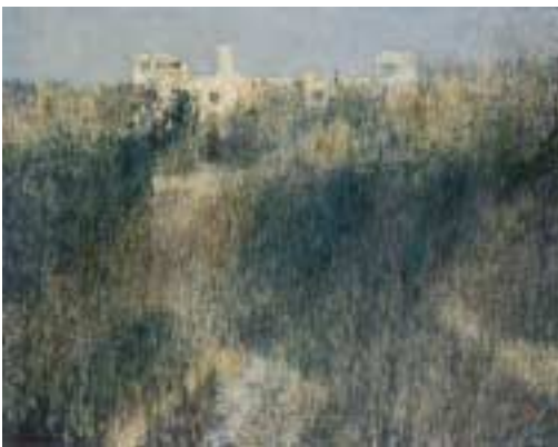
ほんじょう たけし 本莊 起「療養所のある丘」 1987年/油彩・キャンパス 72.5×90.8cm

吹奏楽団の定期演奏会 6月9日(日)、午後6時 開演/市民センター/入場 料七百円(前売り五百円) 中学生以下無料/カルメン 組曲ほか/岡平塚ウインド オーケストラの木戸(070) 5666 4014 平塚フィル定期演奏会 6月16日(日)、午後2時開 演/市民センター/入場料 一千円/託児室五百円/要予 約/キューバ序曲ほか/岡 平塚フィルハーモニー管弦 楽団の木谷(35)2239