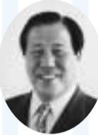
吉野 稜威雄 市長