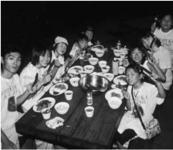
みんなで作った食事はおいしいよ。

申し込み先 総務課(〒254-8686浅間町9-1、121-8763、623-9467) 平塚市ホームページのURLは1面題字右横に掲載