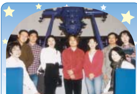
11月に博物館のプラネタリウムでコンサートを開いたアクアマリンと天体観覧会のみなさん

星座観察と言っても難しく考えることはないんです。望遠鏡を持っていなくても、天文なんて分からなくても大丈夫。星に手は届かないけど、身近なものとして考えてください。晴れた夜に、ふと空を見上げれば星は輝いてくれますよ。