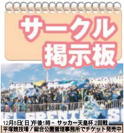
12月8日(日)午後1時~ サッカー天皇杯2回戦 平塚競技場/総合公園管理事務所にてチケット発売中