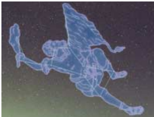
冬を代表する星座・オリオン座

発行 平塚市 編集 企画部広報課 〒254-8686 神奈川県平塚市浅間町9番1号 電話 23 - 1111・35 - 1111 FAX 23 - 9467 http://www.city.hiratsuka.kanagawa.jp/ 発行部数 104,000部 (毎月1日・15日発行)