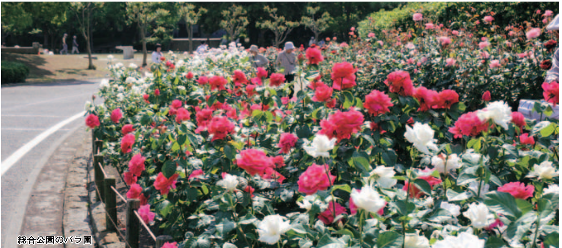
総合公園のバラ園