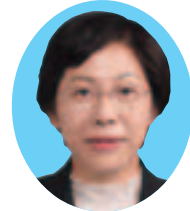
松本敏子 (日本共産党 平塚市議会議員団)