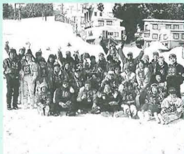
スキーって楽しい