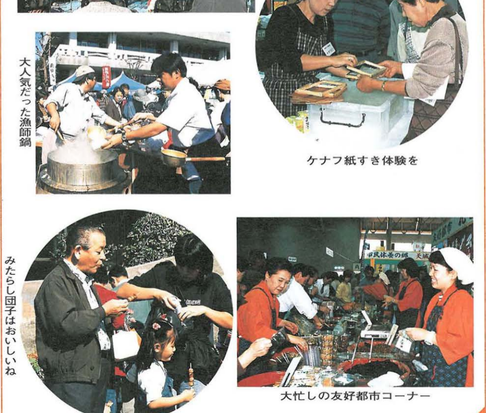
広場でウエスタンコンサート

好天に恵まれた産業まつり3日目の11月8日(日)。漁師鍋コーナーや友好都市のコーナー、その他のコーナーにも長い行列ができ、大勢の家族連れでにぎわっていました。