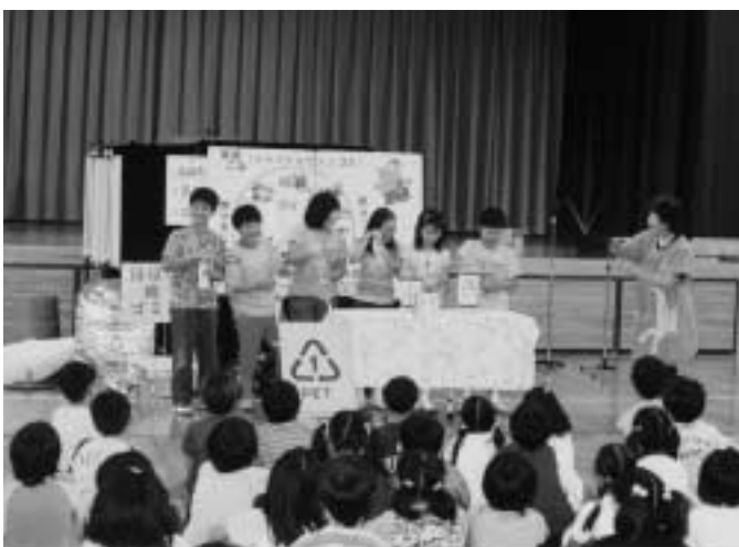
港小学校で行われた〇み学級

議員 〇み問題は質的に量的にも全国の自治体が抱える問題となっており、本市においても〇みの減量化は大きな課題である。リサイクルプラザの建設は、〇みの再利用による減量化や埋め立て処分場の延命効果も期待される。建設に当たっては、基本的な考えを聞きたい。