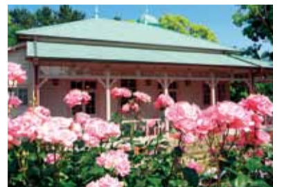
八幡山公園に咲くバラの花

本会議2日目から5日目にかけては代表質問と総括質問を行いました。代表質問では、各会派の議員が施政方針や平成26年度の予算編成などを中心に、市政全般に関する質問をしました。総括質問では、ツインシティ整備推進事業の進捗状況や今後の展開、保育所の待機児童対策、地域経済の活性化や産業振興策、教育環境の整備、市の特産品のバラを生かしたまちの魅力アップなど、幅広い分野からまちづくりの方向性を問いました。