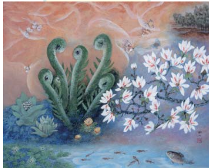
工藤甲人《春の序幕》2008年 当館寄託