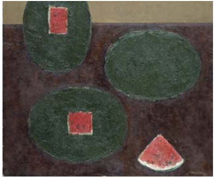
鳥海青児《メキシコの西瓜(メキシコ風の西瓜)》1961年