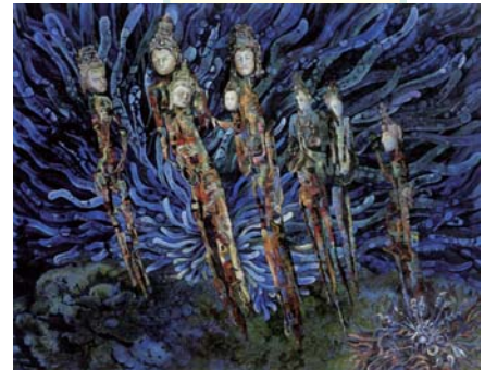
平野杏子《善財南へ行く》1974年