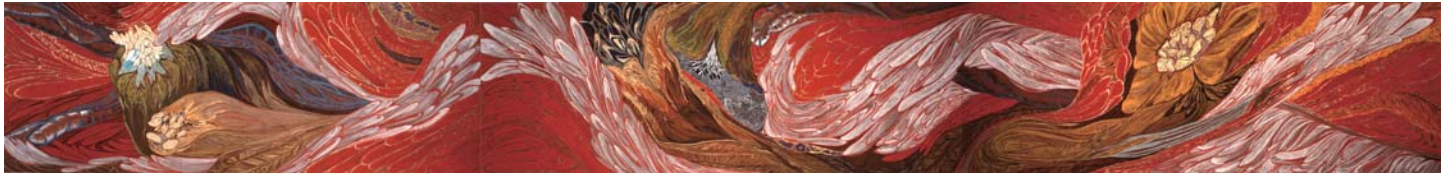
濱田樹里《流・転・生》2011年