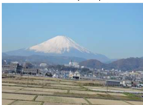
岡崎架道橋からの眺め