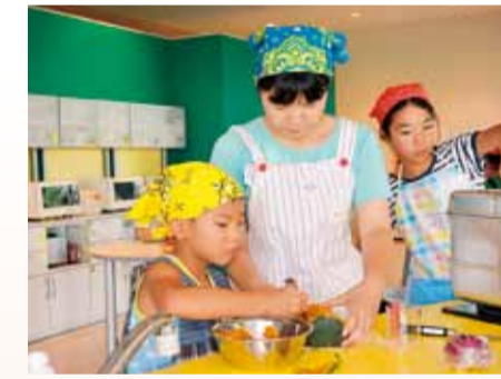
採れたて野菜が食べられます

野菜の種や苗の植え付けから収穫までを体験し、収穫した野菜を調理します。農の体験・交流館(寺田縄457-5)。全日程に参加できる、市内在住の小学生と保護者10組(抽選)。全3回。荒天中止。長靴・軍手・タオル。汚れても良い服装でお越しください。1組1,000円(③は花菜ガーデン入園料も)。 ①種・苗植え付け 4月22日(土) 午前10時〜正午。 ②種まき・管理作業 5月27日(土) 午前10時〜正午。 ③収穫・調理体験 7月22日(土) 午前10時〜午後2時30分。花菜ガーデン(寺田縄496-1)で調理します。 電話で、3月27日(月)までに、農の体験・交流館 ☎58-5201へ。