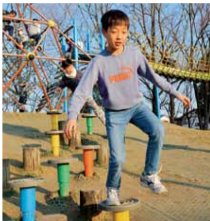
放課後になるとたくさんの児童が集まります

東側にはローラー式の滑り台などの遊具や、多目的広場があり、休日だけでなく、平日も学校が終わると、放課後の遊び場として、子どもたちが