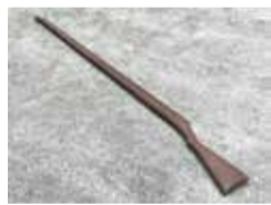
銃剣道で使う「木銃」。長さ166センチメートルで鉄砲の形を模している。文字どおり、木のできた「銃」。