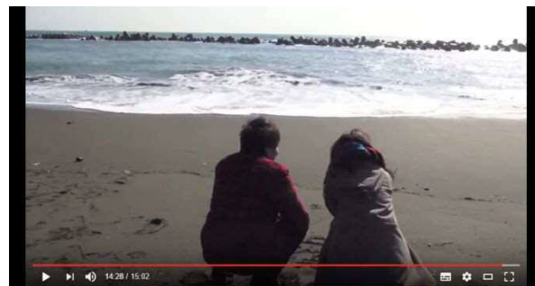
大学生がつくる平塚市のCM