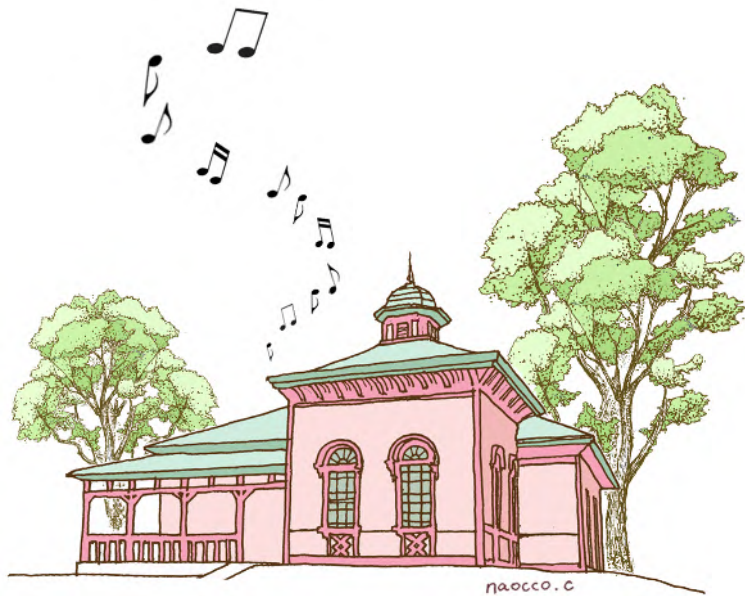
国登録有形文化財(建造物)