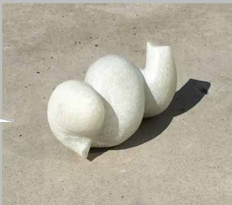
◀ 講師による完成見本

他の素材とは異なり、時間はかかりますが、その分手の動きと一体となって形をつくることができます。重さや硬さ、手触りなどを通じ、目で見ただけではわからない、手で“触る”ことから湧き起こった思いを作品にしてみましよう！