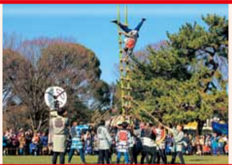
迫力の演技を披露します

消防車両のパレードや、伝統のはしご乗りなどをします。消防団の小型動力ポンプやはしご車などによる一斉放水も見逃せません。 平成30年1月6日(土)午前10時～11時45分。荒天中止。総合公園平塚のはらっぱ。