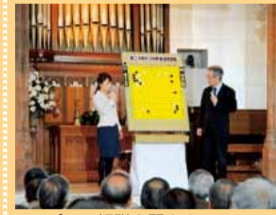
プロの解説を聞きませんか

謝依旻女流棋聖がタイトル防衛を目指し、挑戦者と平成30年1月19日(金)に対局します。 ホテルサンライフガーデン(榎木町9-41)。先着順。 ①前夜祭 立食パーティーやお楽しみ抽選会など。参加者1組5、6人程度の連基指導碁もあります。18日(木)午後7時～8時30分、連基指導碁は5時40分～6時50分。70人。男性4,000円・女性3,500円・高校生以下2,000円。 ②大盤解説会 19日午後1時～4時。140人。