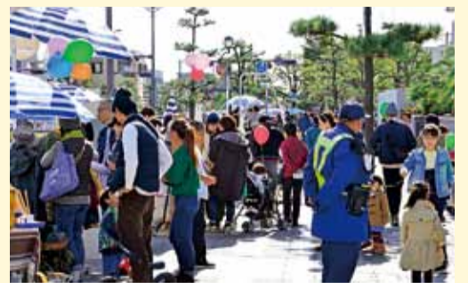
いつもは閑静な「なぎさプロムナード」が大にぎわい

「ひらパラ」。この言葉を初めて聞いたという方もいるでしょう。これは、ビーチパラソルが目印のマルシェ(市場)イベント「ひらつかパラダイス」の愛称です。11月12日、平塚駅南口から海岸へと続く県道、なぎさプロムナードの歩道を会場に開かれました。 パラダイスとパラソルをかけた愛称が示すように、青と白のボーダー柄でそろえたパラソルがシンボル。その下には、小物や衣類、お菓子などが並び、キッチンカーからはおいしそうな匂いが漂っていました。また出店した28店に、周辺の店舗も加わったことで、沿道全体ににぎわいが生まれました。秋晴れに恵まれ、詰めかけた方は数千人いたでしょうか。特に、小さなお子さんを連れた家族の姿が目につきました。 昨年、本市のイメージについて調査したところ、都内や横浜市、川崎市などに住む人は、平塚市に対しては「好き」としたイメージを持っていないという結果が出ました。魅力のある「海」も連想されない現状から、私としては「海のあるまち」をもっとアピールしたいと考えました。 注目したのが、なぎさプロムナードの洗練された海辺の雰囲気です。ここを活用し、まちの魅力を発信できないかと案を巡らせました。 そうした折、海岸エリアの魅力アップに共感する市民の皆さんによって、ひらつかパラダイス実行委員会が立ち上げられました。実行委員は30～40歳代が中心で、市職員とともに、県道の使用許可や警備態勢など、開催までに立ち回す。実現に至りました。 今回の開催にあたり、市民の知恵と力、まちの活気を肌で感じられたことに心から感激しています。 市総合計画では、まちづくりの指針に「選ばれるまち・住み続けるまち」を掲げています。これからも市民の皆さんとともに、平塚のイメージ向上と魅力の発信に努めてまいります。