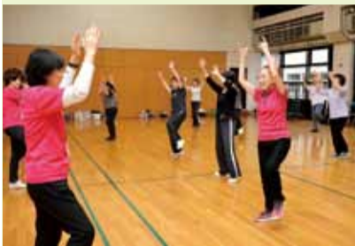
楽しく体操します

平成30年1月19日(金)午後1時30分～3時。金目公民館(南金目966)。飲み物・タオル・バスタオル・室内用運動靴。