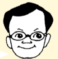
落合克宏 市長こらむ