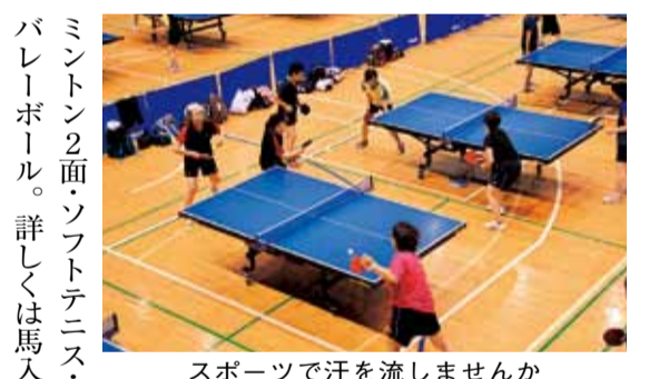
スポーツで汗を流しませんか

応募方法は4面 育館温水プール。先着順。400円。小・中学生200円。 着衣泳体験 午後1時30分。小学生以上の方50人。小学校1～3年生は保護者も一緒に体験してください。1・5歳以上の空のペットボトル・水着・水泳帽・ゴーグル・着衣泳用の長袖シャツ・長ズボン・靴・ビニール袋。 シンクロ体験 午後2時。小学校4年生以上でクロール・平泳ぎ・背泳ぎ全てで25メートル以上泳げる方50人。水泳帽・ゴーグル・お持ちの方はフリスクリップ。 電話または直接、火曜日曜日の午前8時30分～午後5時に、総合公園管理事務所 ☎35-2233へ。