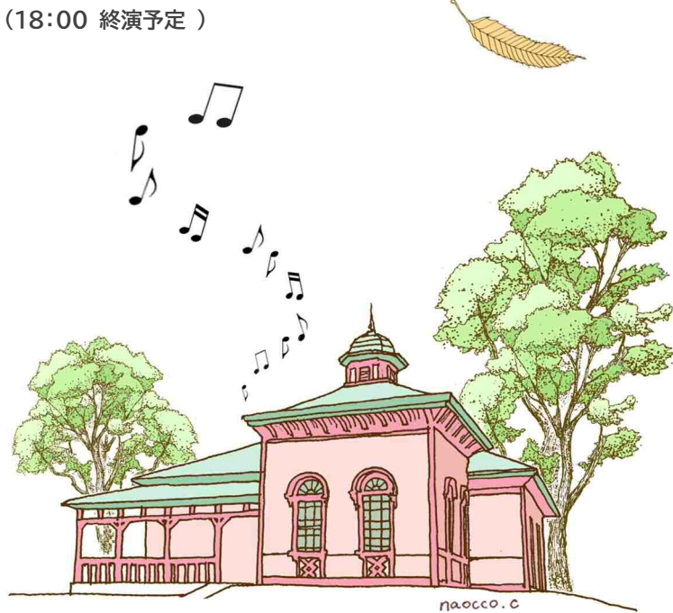
国登録有形文化財(建造物)