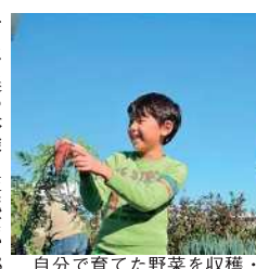
自分で育てた野菜を収穫・調理します

7月28日(土)午前10時～正午。市民活動センター。市民活動中(災害が起きた場合に備え、防災の知識を学びます)。 8月8日(水)午前10時～正午。市民活動センター。市民活動をしている方ら20人(先着順)。三角巾またはバンダナ・フェスタオル。500円。 必要事項を、電話またはファクスで、市民活動センター ☎21-7517 宛22-13701へ。