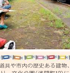
身近にある昔の道具や市内の歴史ある建物、土器などの遺物、地域の祭り、文化公園(浅間町12)にあるD52型蒸気機関車を題材にした作品を募集します。

夏休み下水道教室 施設の見学や微生物の観察、水質実験などをします。各50人(先着順)。小雨決行。 上・下水道コース 8月7日(火)午前9時30分～午後4時。四之宮管理センター(四之宮4-19-1)に集合・解散。昼食。 下水道コース 12日(日)午前9時30分～正午。柳島管理センター(茅ヶ崎市柳島1-9-0)。 電話で、県下水道公社 ☎55-7438へ。