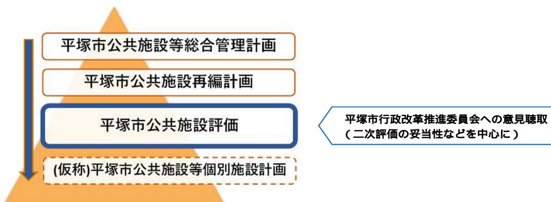
図1 公共施設マネジメントの取組

将来にわたって持続可能な公共施設等の最適な管理運営を実現することを目的に策定した「平塚市公共施設等総合管理計画」に基づき、図1のとおり公共施設マネジメントの取組を進めています。