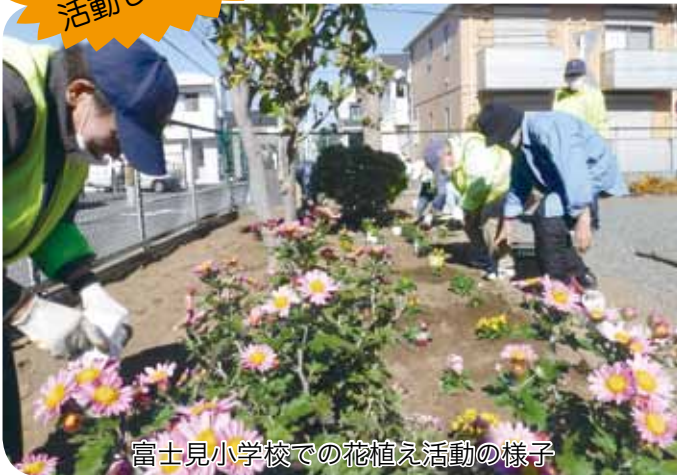
富士見小学校での花植え活動の様子