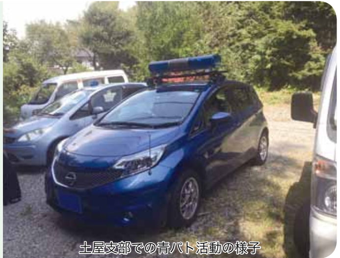
土屋支部での青パト活動の様子

青色回転灯を点灯させてパトロールすることで、警戒していることをアピールし、犯罪の機会をなくすことで被害を未然に防ぐ効果もあります。