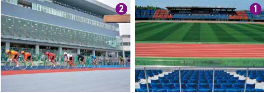
①平塚競技場②平塚競輪場 ③平塚文化芸術ホール(令和4年3月供用開始予定)

①～③の施設に愛称を付けて、企業名や商品名などを宣伝しませんか。公募期間は9月16日(水)までです。条件など詳しくは市ウェブをご覧ください。