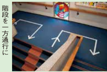
階段を一方通行に