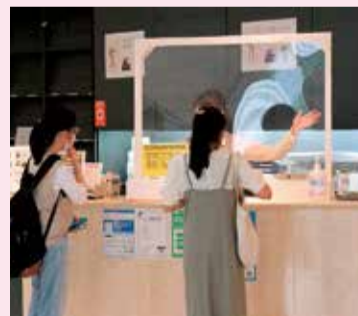
受付では飛沫感染を防止するため、透明シートを設置しています

美術館では、ソーシャル・ディスタンスを確保するように看板で案内したり、3人掛けベンチの真ん中の座席を使えないようにしたりと、人と人との距離を取るための工夫をしています。不特定多数の方の接触を避けるため、図書コーナー・情報コーナー・コインロッカー・冷水機の利用は中止しています。