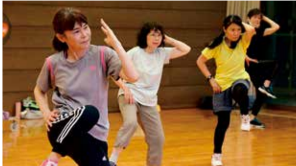
音楽に合わせて軽快に踊ります