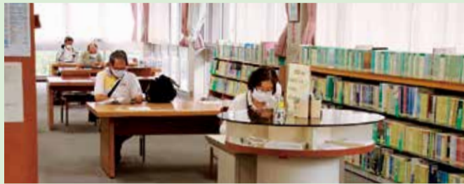
4人用の机に椅子は2つです

北・西・南の各図書館も開館していて、本の閲覧や貸し出しなどのサービスを利用できます。