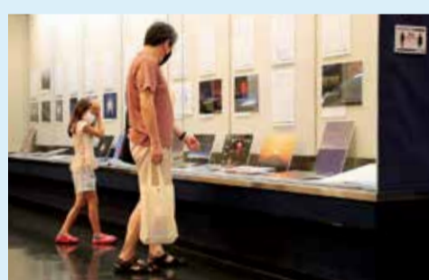
特別展「空を見上げよう 光と色の不思議」を楽しんでいました。館内にはソーシャル・ディスタンスの確保を促す張り紙があります