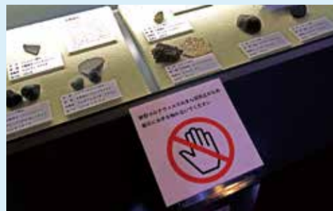
展示物には触れず、目で見て楽しんでください

展示物を触ったり解説を聞いたり、見るだけではなく五感を通じて学べるのが魅力の博物館。しかし現在は、展示物を介してウイルスが広まるのを防ぐため、展示物には触らないように注意を呼び掛けています。