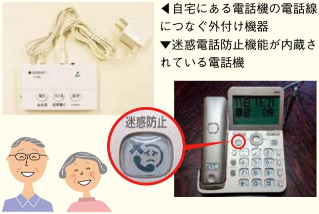
▲自宅にある電話機の電話線につなぐ外付け機器 ▼迷惑電話防止機能が内蔵されている電話機

☎ 各公民館などにある申請書兼実績報告書と必要書類を、郵送または直接、本館4階の危機管理課 ☎ 21-9863へ。