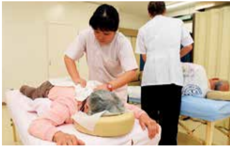
心と体をすっきりさせませんか

新型コロナウイルスの影響により、広報ひらつかに掲載している記事の内容が急きょ変更される場合があります。各記事の内容や実施する場合の感染予防対策など、詳しくは市ウェブをご覧ください。