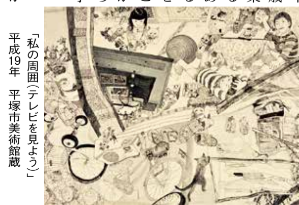
「私の周囲(テレビを見よう)」 平成19年 平塚市美術館蔵

美術館は新型コロナウイルス 感染症の影響で臨時休 館していましたが、8月 中止となりましたが、8月 1日から新たに「夏の所蔵 品展 日常という宝物」を スタートします。いまだ厳 しい社会状況では、何気な い日常が意外とおもしろく感 じます。本展では、こうし た日常をテーマとした44点 の作品を展示します。