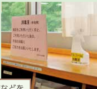
小まめに手指消毒ができるように、消毒液を置いてあります