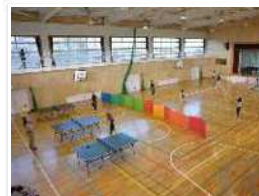
学校体育施設等の開放