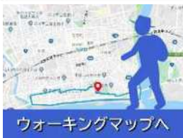
ウォーキングマップへ