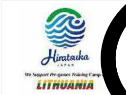
ホストタウン・事前キャンプ