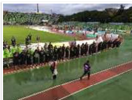
湘南ベルマーレ観戦記