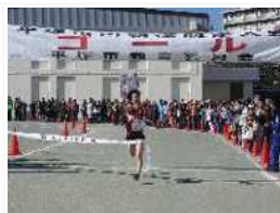
市内駅伝競走大会