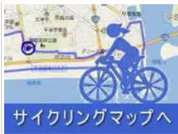
サイクリングマップへ