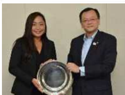
平塚にゆかりのあるスポーツ選手