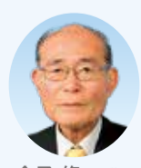
金子 修一 議員