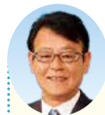
「夢ある未来」平塚を創る