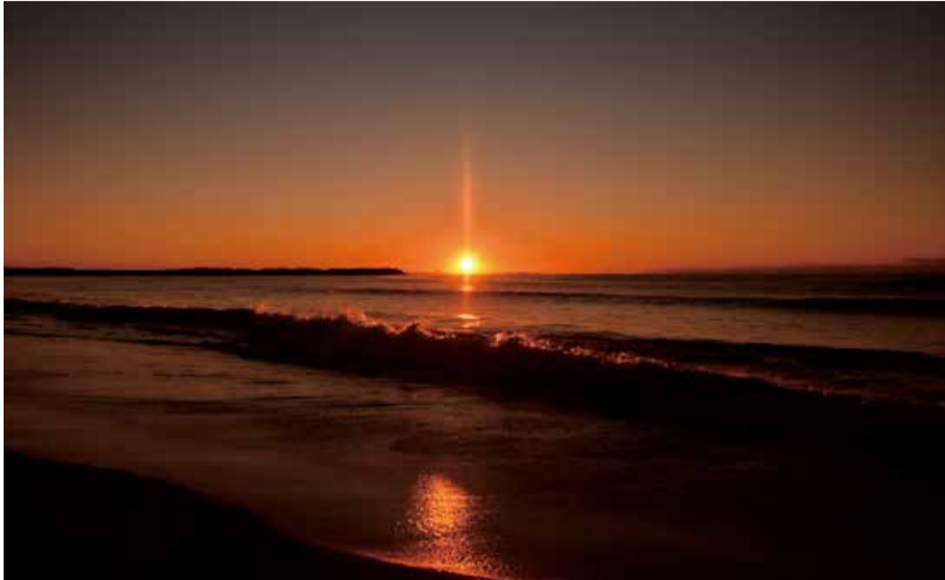
「波間に輝く初日の出」