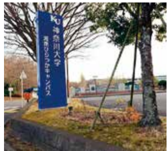
令和5年4月に完全撤退する神奈川大学湘南ひらつかキャンパス

市長 市から具体的な提案をするのは難しいが、大学にはそのような思いを伝えていきたい。