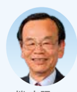
端 文昭 議員