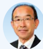
須藤 量久 議員