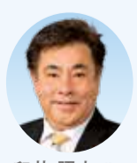
白井 照人 議員

が、本人は参加したいのに、校長の承認を得られず引率教員がいなかったために大会に参加できないというのは本末転倒である。大切なのは子供たちの希望や夢を実現させることであり教師の都合ではない。部活動は大切な教育の一環なので、生徒が希望すれば大会に参加できるように、また、民間の指導者でも引率できるように規約を改正すべきではないか。