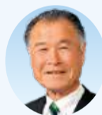
黒部 栄三 議員