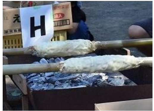
グループで協力して、 1つのバウムクーヘンを作ります

親子で協力して竹を使ったワイルドな バウムクーヘンを作ります。 楽しいひとときを過ごしなが 親子のふれあいを深めてみませんか?