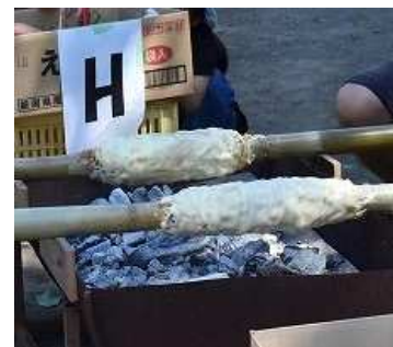
グループで協力して、1つのバウムクーヘンを作ります

親子で協力して竹を使ったワイルドなバウムクーヘンを作ります。 楽しいひとときを過ごしながら、親子のふれあいを深めてみませんか?