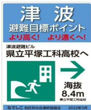
表示板(避難目標ポイント) ⇒の方向へ避難する