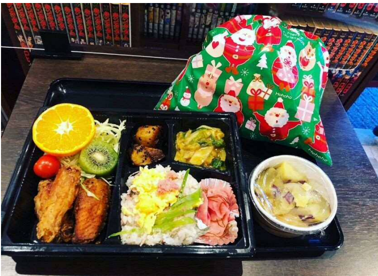
2021年クリスマス付近のお弁当 子どもへプレゼント付き