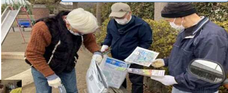
表示板取り付けの事前打ち合わせ