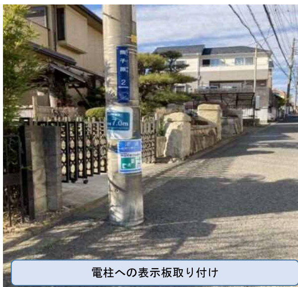
電柱への表示板取り付け