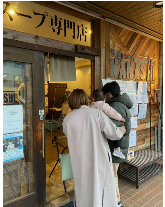
お弁当をお待ち頂いている様子