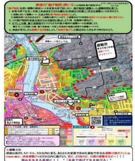
使い方、避難時間追加