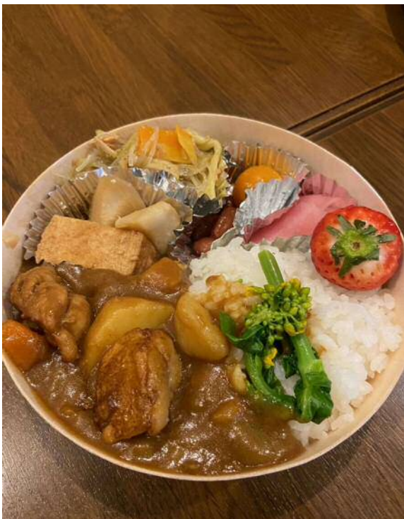
未就学児用のお弁当