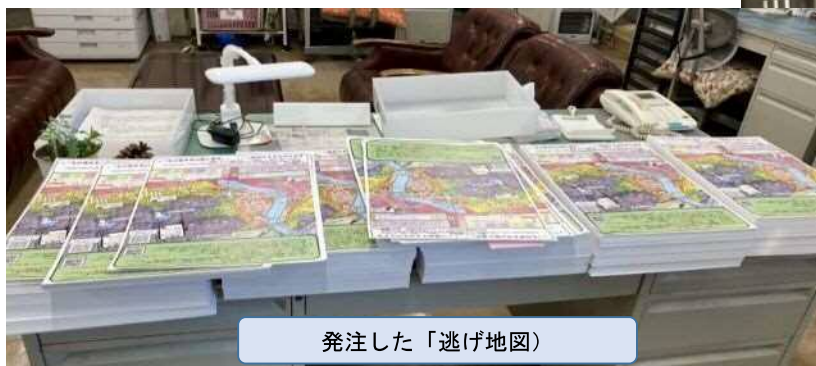
発注した「逃げ地図」

発注した「逃げ地図」と「津波避難ポイント」表示板、「逃げ地図」の家庭内での記入、掲示（例）