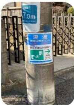
電柱に設置した 表示板