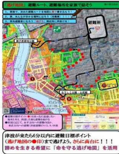
標準避難ルート追加