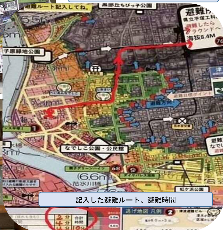
記入した避難ルート、避難時間