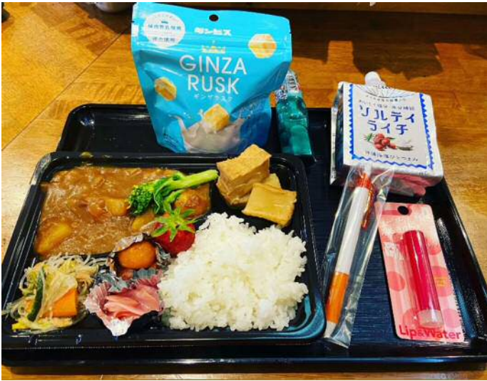
子ども・大人・シニア用のお弁当