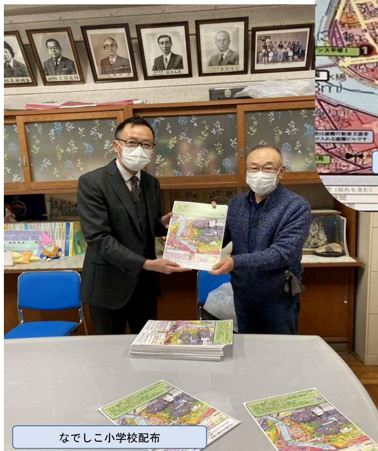
なでしこ小学校配布