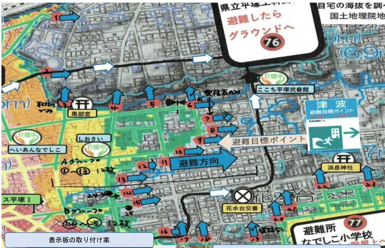
表示板の取り付け案