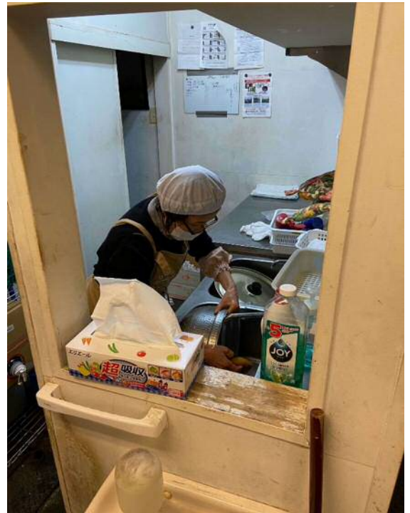
洗い場での洗い物の様子