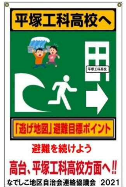
撫子原自治会単独検討