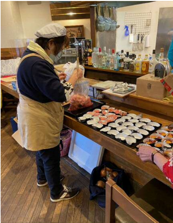
お弁当への盛り付けの様子