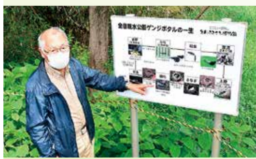
ホタルの説明をする米村代表