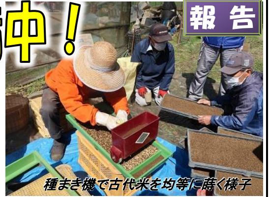
種まき機で古代米を均等に蒔く様子

田植え当日は、市の事業(市民と大学生による里地里山再生プロジェクト)の田植えも開催されており大賑わいでした。土屋に多くの方が訪れ、田植えや、里山の生き物とふれあいを楽しみ喜んでいました。