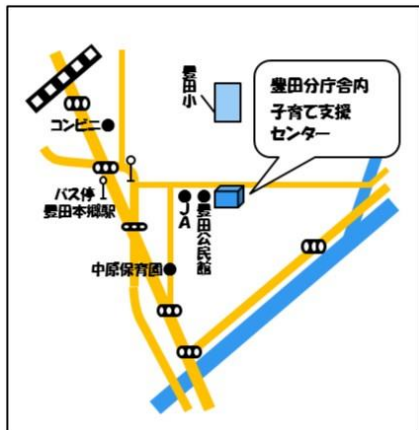
子育て支援センター