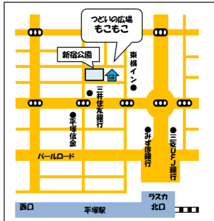
つどいの広場 もこもこ