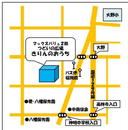
つどいの広場 きりんのおうち