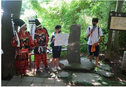
↑ 土屋一族の墓(下庶子分)

土沢中学校探究グループと連携し、道中に中学生から土屋氏にまつわるクイズを出題してもらい、みんなで解きながら歩きました。土屋一族の墓・土屋城址・大乘院・熊野神社・水呑地蔵・牟坂でクイズがありました。中学生ならではの視点で、土屋郷土史いろいろはかるた、インターネット等を参考によく問題が作られていて、参加者から大好評でした。