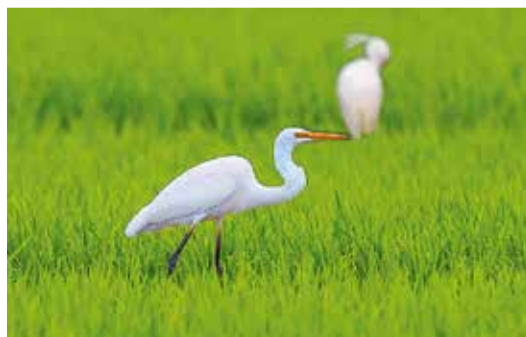
水田に降り立つダイサギ

野鳥は思っているよりもずっと身近な存在です。自宅の庭や公園、街路樹などでも見られます。この特別展を、多くの皆さんが身近な環境に関心を持つきっかけにしてほしいと願っています。