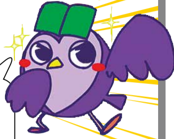
平塚市図書館のキャラクター「ぶくまる」

小・中学生のみんな、夏休みに図書館には行ったポ？ 図書館は、ただ本があるだけの場所じゃないポ。宿題や勉強にも役立つんだポ。図書館でどんな発見をしてどんな本と出会えたのか、おうちの人にも教えてあげてポ。 大人のみなさん、図書館のレファレンスサービスを知ってるポ？ 図書館を便利に使ってみてほしいポ。