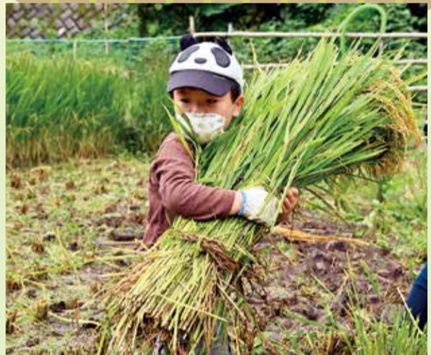
機械を使わず、全て手作業です