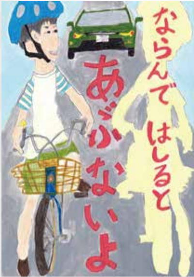
令和3年度の最優秀賞作品