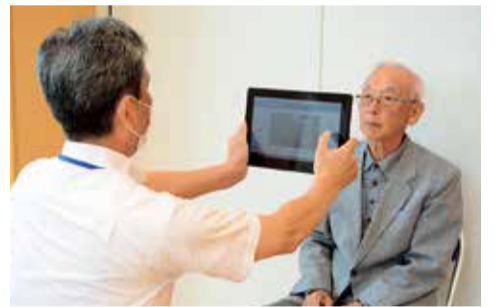
証明写真の撮影も市職員が手伝います

夏休みに神奈川県立図書館を利用しませんか。資料の閲覧・複写を利用できます。貸し出しはできません。土・日曜日と祝日、8月16日(火)・17日(水)を除く、9月20日(火)までの午前9時10