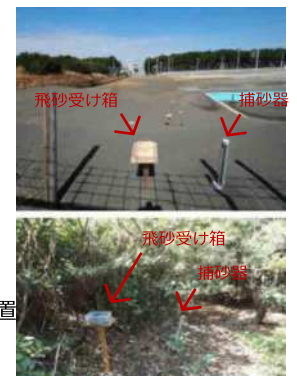
写真2： ②の調査装置 上/A地区 下/B地区