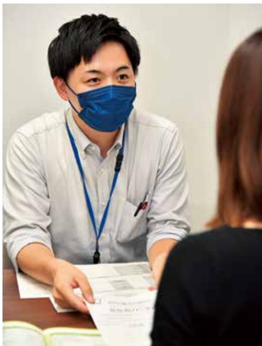
遺族が必要な手続きを案内します

事前予約でスムーズに案内できます。予約がない場合は、亡くなった方の情報をご遺族サポートコーナーで聞き取り、必要な手続きを案内します。この場合、同コーナーで事前の書類の準備ができないため、各課の窓口で申請書へ