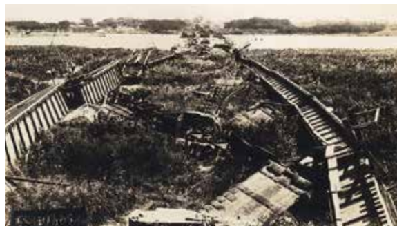
東海道線の馬入川橋梁は上下線とも崩壊

間もなく敬老の日。8月1日現在、100歳以上の市民は過去最多の166人、99歳の白寿の方は過去最多に並ぶ84人いらっしゃいます。平塚市は今年4月1日に市制施行90周年を迎えました。まちの発展に力を尽くしてくださった皆さまに感謝申し上げます。白寿の方が生まれた大正12年(1923年)は、9月1日に関東大震災が発生しました。相模湾北西部を震源とするマグニチュード7.9の巨大地震により、全国の死者・行方不明者は10万5000人以上、地震や火事による全半壊・焼失などの家屋は37万棟以上という、未曾有の被害がもたらされました。