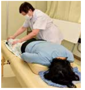
疲れを癒しませんか

電話・ファクス・メールで、生きがい事業団☎33-2335 FAX35-1744 E-mail:kigai@ma.scn-net.ne.jpへ。