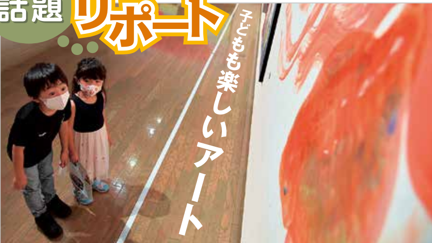
子どもも楽しむアート

「気になる! 大好き! これなあに? こどもたちのセレクション」展を9月19日(祝)まで、美術館で開いています。