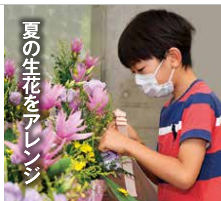
夏の生花をアレンジ

参加者らはレクチャーを受けた後、リボンや色とりどりの花を飾り付けました。個性あふれるさまざまな作品はどれも素晴らしく、参加者らも真剣かつ楽しそうに取り組んでいました。