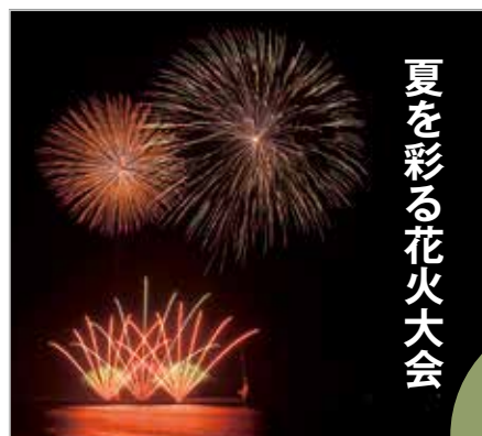
夏を彩る花火大会