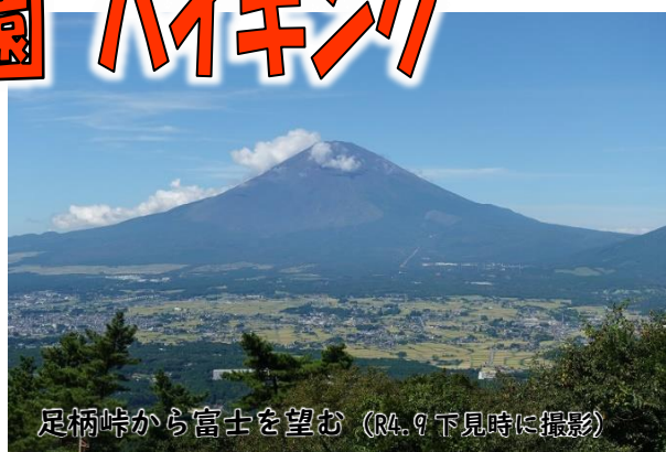
足柄峠から富士を望む (R4.9下見時に撮影)

夕日の滝などの金太郎ゆかりの地を回った後、地蔵堂から足柄古道の石だたみを歩き、足柄峠を通り、足柄万葉公園から林の中を下り地蔵堂に帰ってくるコースです。晴れた日に足柄城跡から眺める富士山は絶景です。