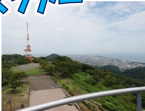
湘南平の展望台から、頼朝の拳兵や和田の乱について解説します。