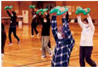
浮き輪のようなベルを両手で持って全身を動かします

11月9日(水)午後1時30分~3時。平塚栗原ホーム(立野町31-20)。市内在住・在勤。在学の方30人(先着順)。筆記用具。