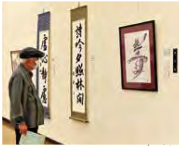
力作を見に来ませんか