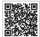
県内で発熱診療を実施 している医療機関一覧

参考 兵庫県立こども病院感染対策部感染症内科「お子さんがコロナに罹ったらどうする？自宅療養のポイントver.1.1」