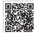
新型コロナウイルス 感染症専用ダイヤル