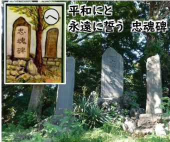
平和にと 永遠に誓う 忠魂碑