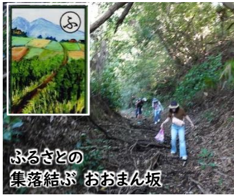
ふるさとの 集落結ぶ おおまん坂