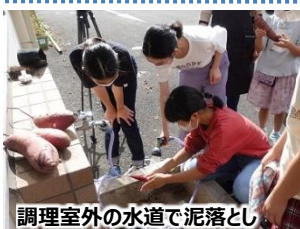
調理室外の水道で泥落とし