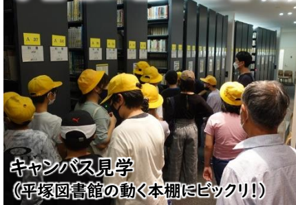
キャンパス見学 (平塚図書館の動く本棚にビックリ!)