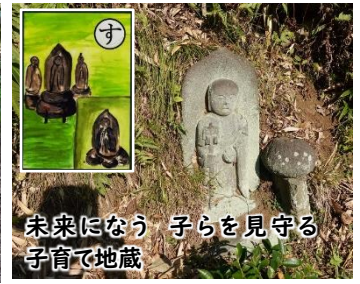
す 未来になう 子らを見守る 子育て地藏

所どころ草木が生い茂り通りづらい道がありました。かるたの解説書に書いてある「夏が過ぎると草木が生い茂って通りづらくなるので集落総出で草刈りをする。これを道普請という。」の意味が良く分かりました。