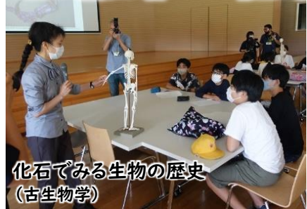
化石でみる生物の歴史 (古生物学)