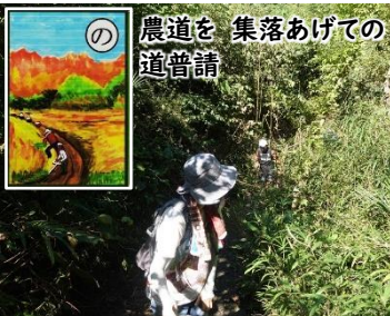
の 農道を 集落あげての 道普請

10月2日(日)に第2回かるためぐりを行いました。今回は、役場道を通り人増方面へあがり、おおまん坂経由で早田・琵琶・惣領分方面へ行き、かるたで詠まれている場所やその周辺の史跡をめぐりました。