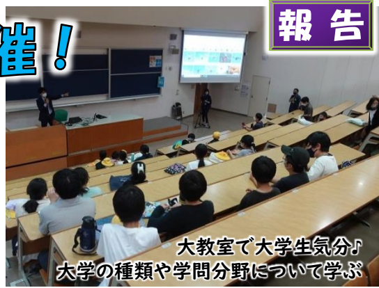
大教室で大学生気分♪ 大学の種類や学問分野について学ぶ

恐竜と人の骨の形を比較し、化石から何の生物かを見分ける方法を教えていただき、子ども達は興味深々に話を聞いていました。「不思議、面白いという気持ちを忘れないことが大事。」「大学は自分で研究テーマを考え、方法を考える」という話が印象的でした。