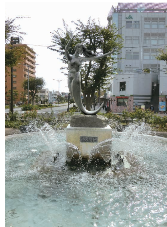
平塚駅南口 人魚の像「海の讃歌」 昭和38年 澤田 政廣 作