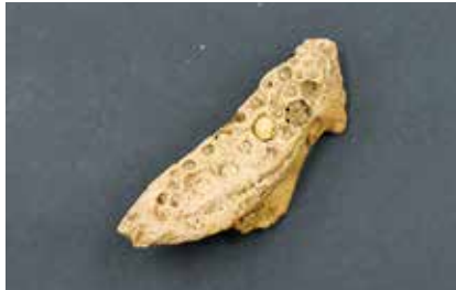
(上)クロダイの顎骨 (下)下顎の骨

新年あけましておめでとうございます。たいへんおめで「タイ」というわけで、魚のタイのお話です。縁起物としてよくネタにもされるタイですが、一体いつから食べられていたのでしょうか。タイトルにもある通りなのですが、縄文時代の遺跡からタイが見つかっているのが、少なくともその時代までには食べられていたことが分かります。縄文時代のタイ、実は平塚市でも見つかっています。普段は収蔵庫に眠っている五領ケ台貝塚から発見された多くの遺物。土器や石器の他にも動物の骨や貝殻があります。その中の一つがタイの骨です。写真上はクロダイの顎の骨です。上が上顎で下が下顎ですね。貝や甲殻類も食べる魚なのでしっかりとした顎です。写真下は下顎を 上から見たもの。一部しか歯が残っていませんが、ボツボツとしたところには歯があったのでしょうか。かなり密集して生えています。魚の顎の骨をじっくり見ることはあまりないので、観察してみると楽しかったです。1階常設展示室で期間限定で展示しています。さて、こうした生き物の骨はどの遺跡でも出てくるわけではありません。日本の土壌は基本的に酸性であることや雨が多い気候であることなどから、骨や木材をはじめとする有機質ものは地中で残りづらいのです。しかし、低湿地や海成の砂地など一部の環境下では、比較的保存状態よく残るケースがあります。貝塚もその一つです。貝塚はより多くの情報をもたらしてくれる、ありが「タイ」遺跡なのです。