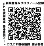
インストール後の新規登録手順