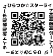
アプリのインストール方法