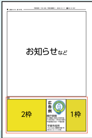
(上)市ウェブサイト(下)広報ひらつかの広告掲載例

市が就労準備支援事業の拠点として設けている施設です。生活リズムの改善や得意なこと探しなど、就労準備の