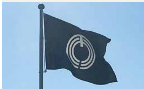
市役所本館で掲揚している市旗

使われています。例えば近くの地区公民館をはじめとした市の公共施設、ごみ収集車などの公用車、市からの表彰状や市ウェブサイトなどのトップページなどで使用されています。市旗にも市章が使われています。市旗は市を象徴する旗で、中央に市章が配置されています。市旗は市の式典や表彰式で使用しているほか、市役所の開庁時には、市役所本館前の掲揚台に掲げています。掲揚している市旗は濃紺白抜きで、大きさは縦140センチ・横210センチ。ダブルサイズの敷布団と同じ大きさです。とても立派なものですので、市役所にお越しの際は、ぜひ一度ご覧ください。