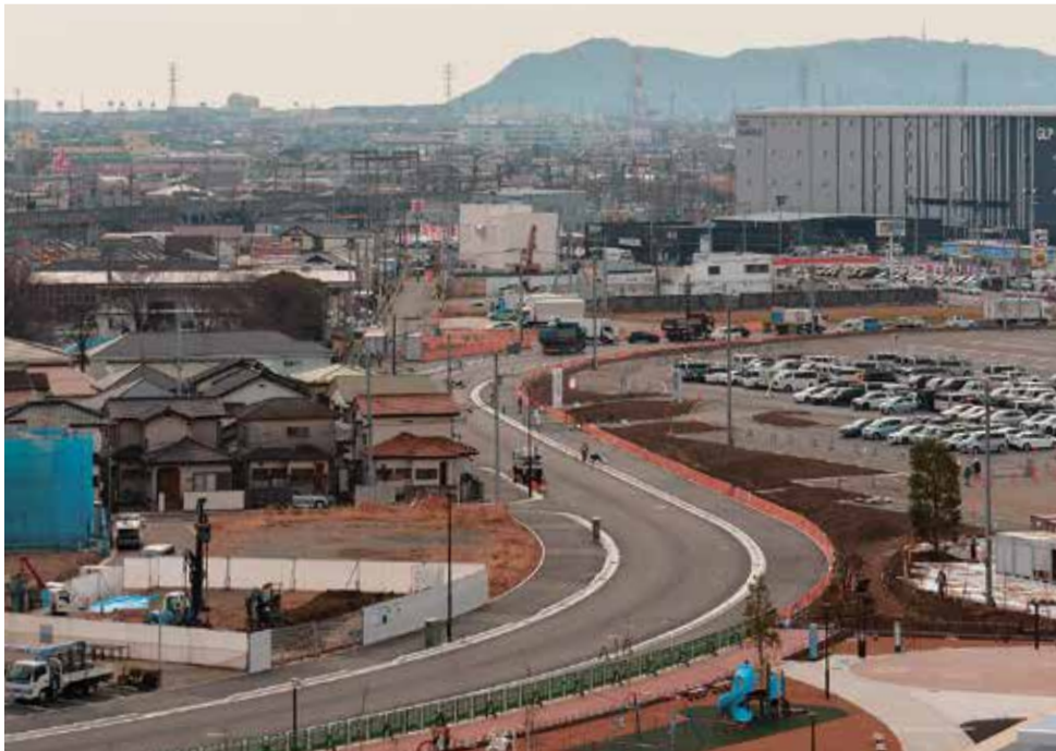
国道129号からつながり、地区の中を走るツインシティ大神線。大きくカーブしているのが特徴です