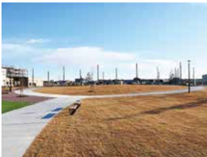
地区の中で一番大きい3号公園です