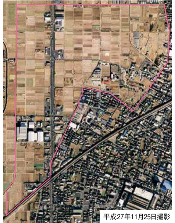
平成27年11月25日撮影 区画整理が始まる前は、田園風景が広がっています