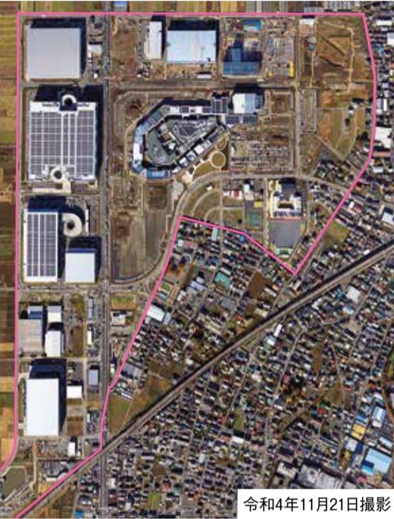
令和4年11月21日撮影 地区の西側には物流施設の倉庫が立ち並んでいます

新型コロナウイルスの影響により、掲載している記事の内容が急きょ変更される場合があります。各記事の内容など、詳しくは市ウェブをご覧ください。また、各イベントなどに参加したり、公共施設を訪れたりするときは、出掛ける前に自宅で体温を測り、マスク持参の上、感染症対策をしてください。