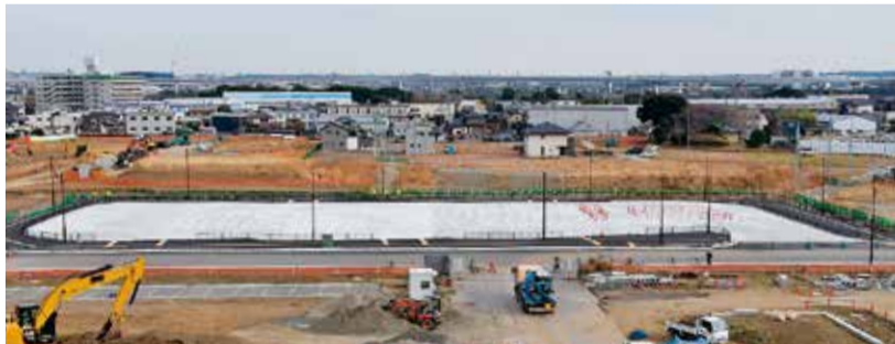
公共交通ネットワークを形成するために整備されているトランジットセンター

「関わってきた多くの人たちが、熱い思いを持って進めてきました。まちができたから終わり、ではなくここから始まりです。次の世代に思いをつないで、まちを育てていかないといけないと思っています」