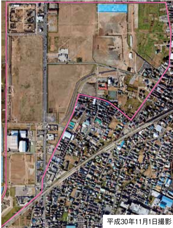
平成30年11月1日撮影 造成工事が進み、まちの形が見えてきました