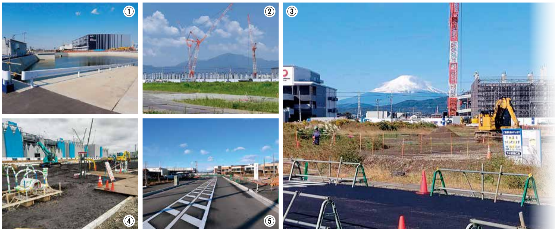
①3号調整池(令和3年3月10日)②大型クレーンで建設が進む物流施設(令和3年6月9日)③工事が進み、見えてきた建物の外観(令和3年10月26日) ④3号公園に健康遊具を設置(令和4年9月21日)⑤地区内のメイン道路、ツインシティ大神線が完成(令和5年1月25日)

各団体から情報提供をしたり市民活動センターの利用者の交流を深めませんか。SDGsカードゲームをしたり