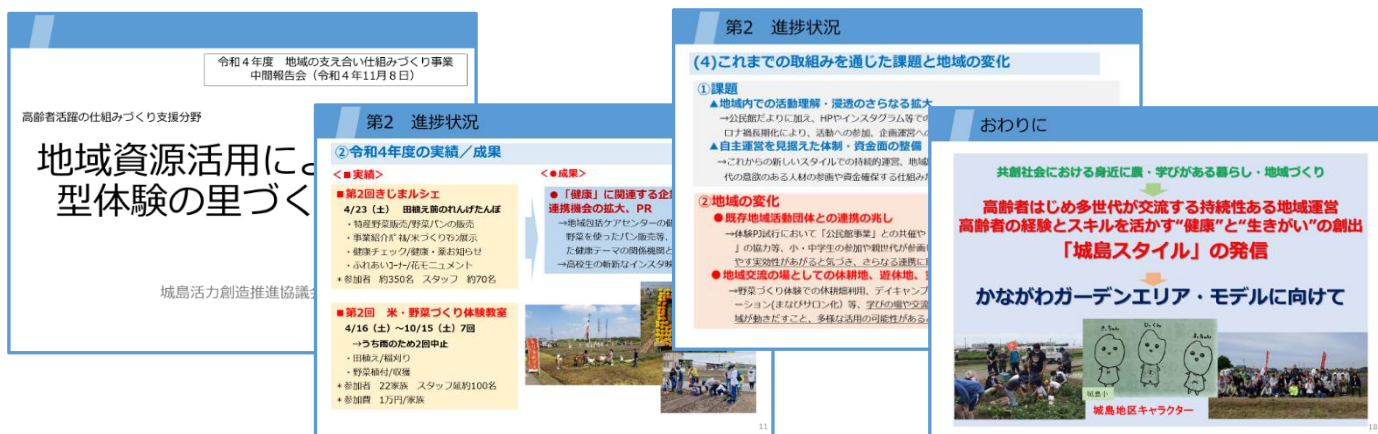
↑ 11/8 県中間報告会での説明資料の一部

https://www.pref.kanagawa.jp/docs/m8u/tiikinosasaeai.html