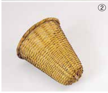
①そばあげざる②みそこしざる