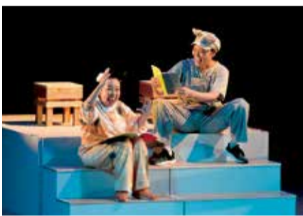
参加団体が丸となって作り上げます

代表者の必要事項・全員の氏名を、電話・メールで、3月3日(金)〜24日(金)に、農の体験・交流館☎58-5201 nosan@へ。