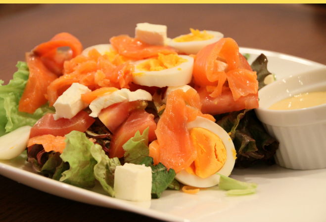
スモークサーモンとクリームチーズのサラダ