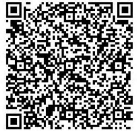
平塚市電子申請システム 申し込み専用ページ